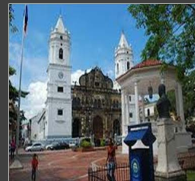
PANAMÁ – ORGANO JUDICIAL DE LA REPUBLICA DE PANAMA