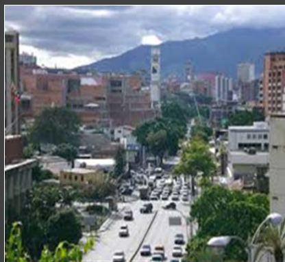
VENEZUELA – TRIBUNAL SUPREMO DE JUSTICIA

Enlaces a las bases de datos en línea a las que puede accederse de forma gratuita y pública, y que contienen, total o parcialmente, resoluciones judiciales o decisiones de órganos administrativos en el ámbito de la propiedad intelectual, o pasajes de dichas resoluciones (Fuente: OMPI)