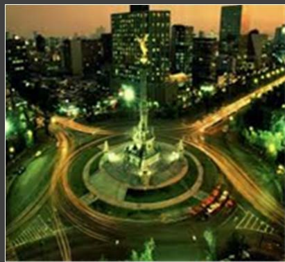
MÉXICO – INSTITUTO MEXICANO DE PROPIEDAD INTELECTUAL