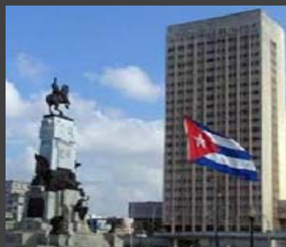
CUBA – PORTAL DEL GOBIERNO