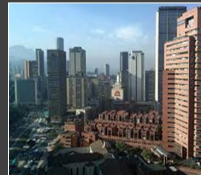
COLOMBIA – CORTE SUPREMA DE JUSTICIA