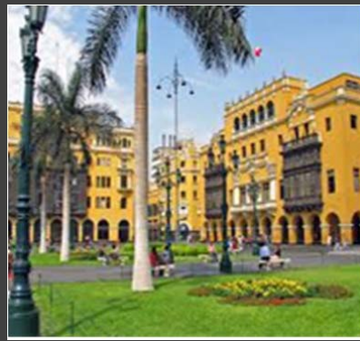
PERÚ - INDECOPI