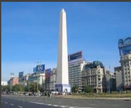
ARGENTINA – CORTE SUPREMA DE JUSTICIA DE LA NACION