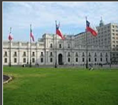
CHILE - INSTITUTO NACIONAL DE NORMALIZACIÓN (INN)