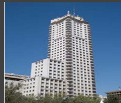
ESPAÑA – CONSEJO GENERAL DEL PODER JUDICIAL