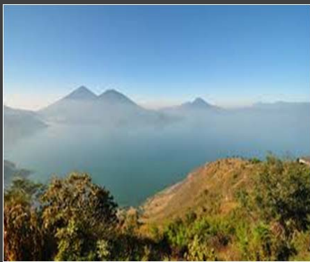
GUATEMALA – CORTE DE CONSTITUCIONALIDAD