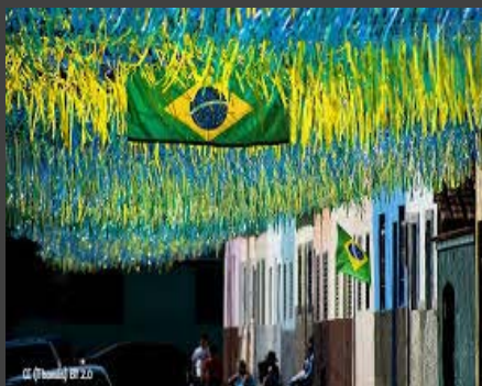
BRASIL – SUPREMO TRIBUNAL FEDERAL