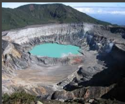
COSTA RICA – PODER JUDICIAL