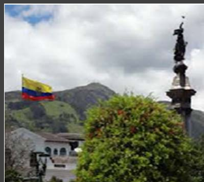
ECUADOR – CORTE SUPREMA DE JUSTICIA