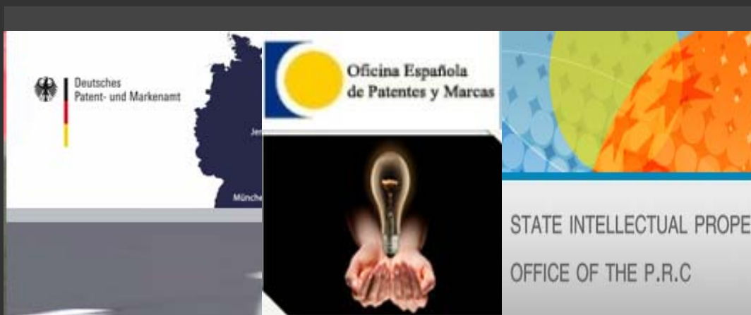
OFICINA ALEMANA DE PATENTES Y MARCAS