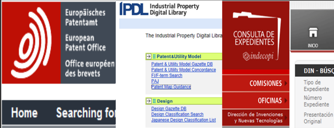
OFICINA EUROPEA DE PATENTES